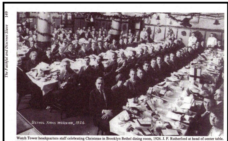
Εορτάζοντας τα..Χριστούγεννα στο «Μπέθελ»!!

Ο Ρόδερφορντ, κυριολεκτικά άρπαξε την περιουσία του Ρώσσελ. Ήταν αρχικά ο δικηγόρος στον οποίο είχε ανατεθεί η διαθήκη του Ρώσσελ. Όμως εκμεταλλευόμενος την εμπιστοσύνη των νομίμων κληρονόμων, χρησιμοποίησε νομικά παραθυράκια και κράτησε την εκδοτική εταιρία «Σκοπιά» του Ρώσσελ για τον εαυτό του, και αυτούς τους χαρακτήρισε «Πονηρούς Δούλους», και τους έδωσε. Σήμερα αυτοί είναι γνωστοί ως «Σπουδαστές της Γραφής», και διατηρούν τα δόγματα του Ρώσσελ, σε αντίθεση με τον Ρόδερφορντ, που άλλαξε σχεδόν τα πάντα, και έκανε τη Σκοπιά μια δικτατορική οργάνωση. Αυτός τους ονόμασε: «Μάρτυρες του Ιεχωβά». Με τη σειρά του, έθεσε ημερομηνίες για το τέλος του κόσμου, και διαψεύστηκε σε οτιδήποτε είχε προφητεύσει.